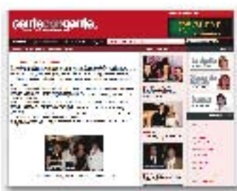
Gente con Gente